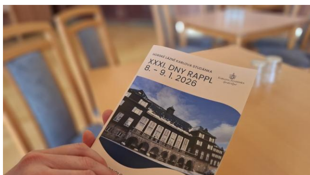
Konference RAPPL obrázek č. 5