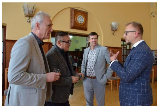
Konference RAPPL obrázek č. 2