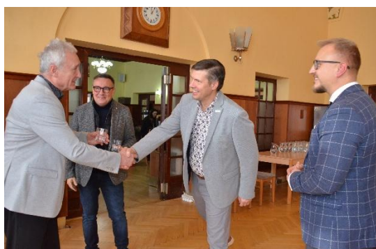
Konference RAPPL obrázek č. 3