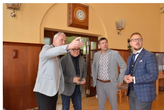
Konference RAPPL obrázek č. 4