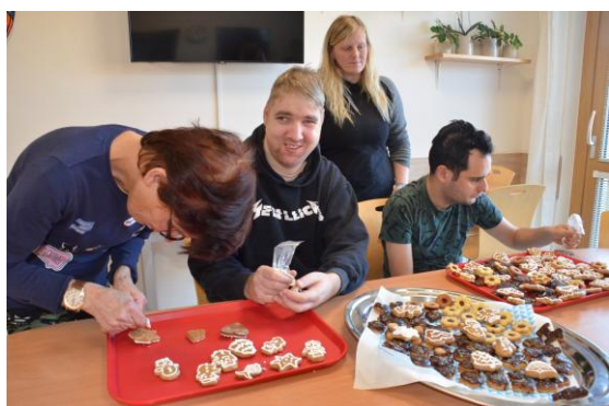
Sagapo – zdobení perníčků